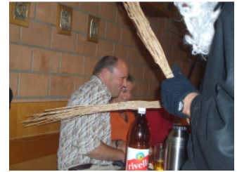
Wer kommt dieses Jahr „dran“??